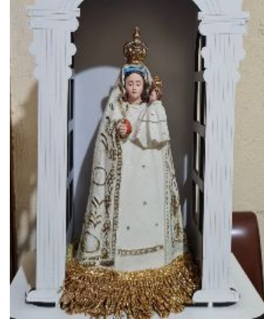
Imagem Peregrina de Nossa Senhora da Luz

Todos somos convidados a participar, nesta segunda-feira, dia 29 de junho, às 20:00 , da missa solene em ação de graças. Não deixe de participar!