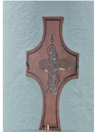
FOTOS DA PLACA COMEMORATIVA DA DEDICAÇÃO DO TEMPLO E DA CRUZ DAS 12 COLUNAS DA IGREJA

NOSSOS POBRES PEDEM AJUDA! Faça sua doação de mantimentos para os assistidos pela nossa Pastoral Social!