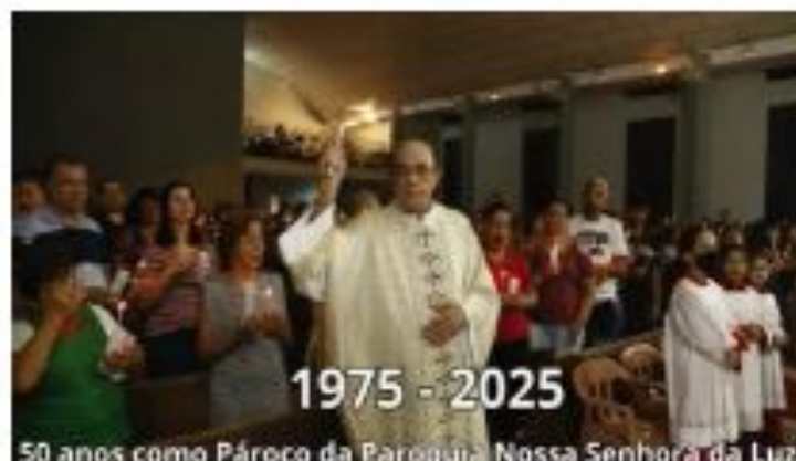
50 anos como Pároco da Paróquia Nossa Senhora da Luz

Todos somos chamados a prestigiá-los, unindo-nos a eles e aos seus padrinhos e familiares, para que, agraciados pela força do Espírito Santo, perseverem na fé e no amor à Igreja. Vamos participar!